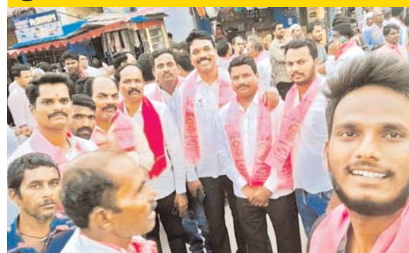
(కామారెడ్డి, ఇటీ సంగతి)