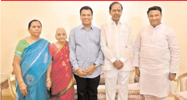
(నిజామాబాద్, ఇటీ సంగతి)