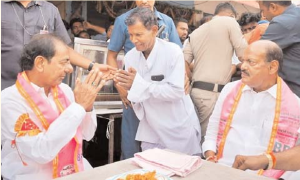
(ఇందల్ వాయి, ఇటీ సంగతి)

లోకసభ ఎన్నికల ప్రచారంలో భాగంగా సోమవారం రాత్రి నిజామాబాద్ వచ్చిన మాజీ సీఎం కెసిఆర్ మంగళవారం సాయంత్రం కామారెడ్డికి బయలుదేరారు.