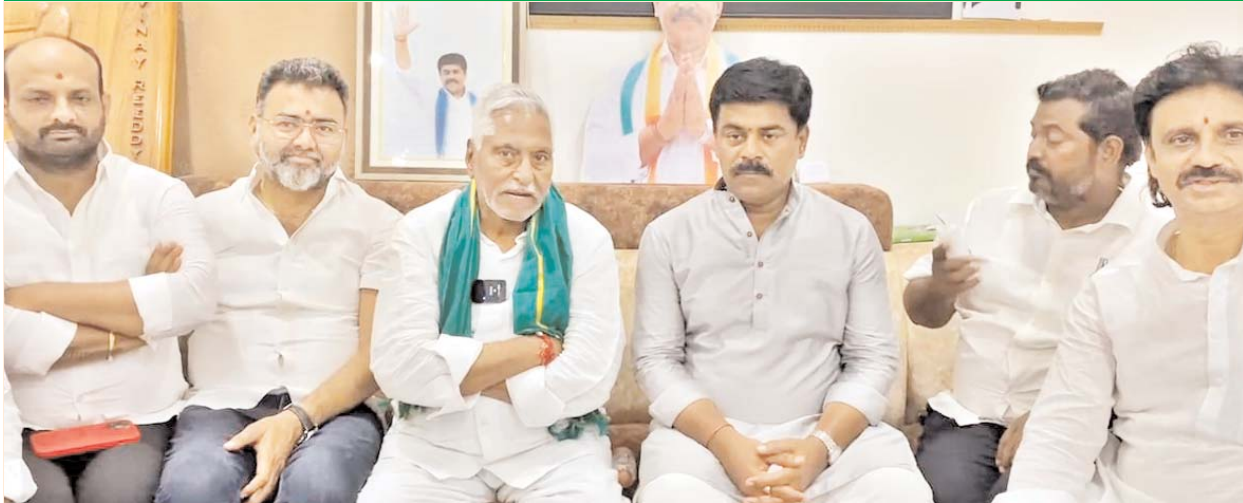
(ఆర్కూర్, ఇటీ సంగతి)