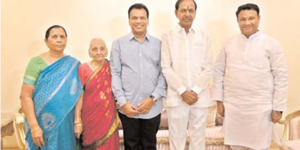
(నిజామాబాద్, ఇటీ సంగతి)