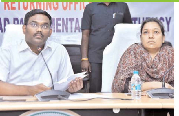
(నిజామాబాద్ ఇటీ సంగతి)