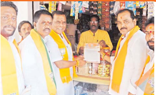
(నిజామాబాద్ ఇటీ సంగతి)