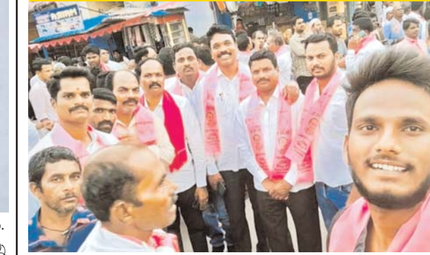
(కామారెడ్డి, ఇటీ సంగతి)