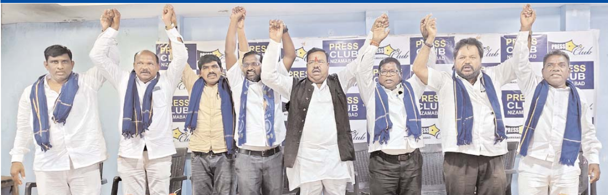
(నిజామాబాద్, ఇటీ సంగతి)